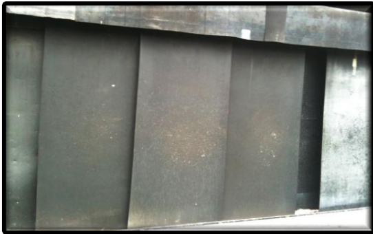
RUTEC R1078 in 6mm