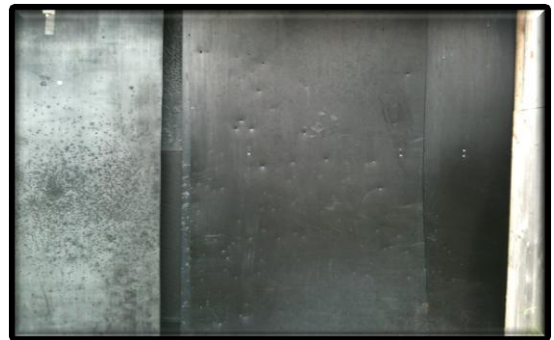
Standard-Material in 6mm